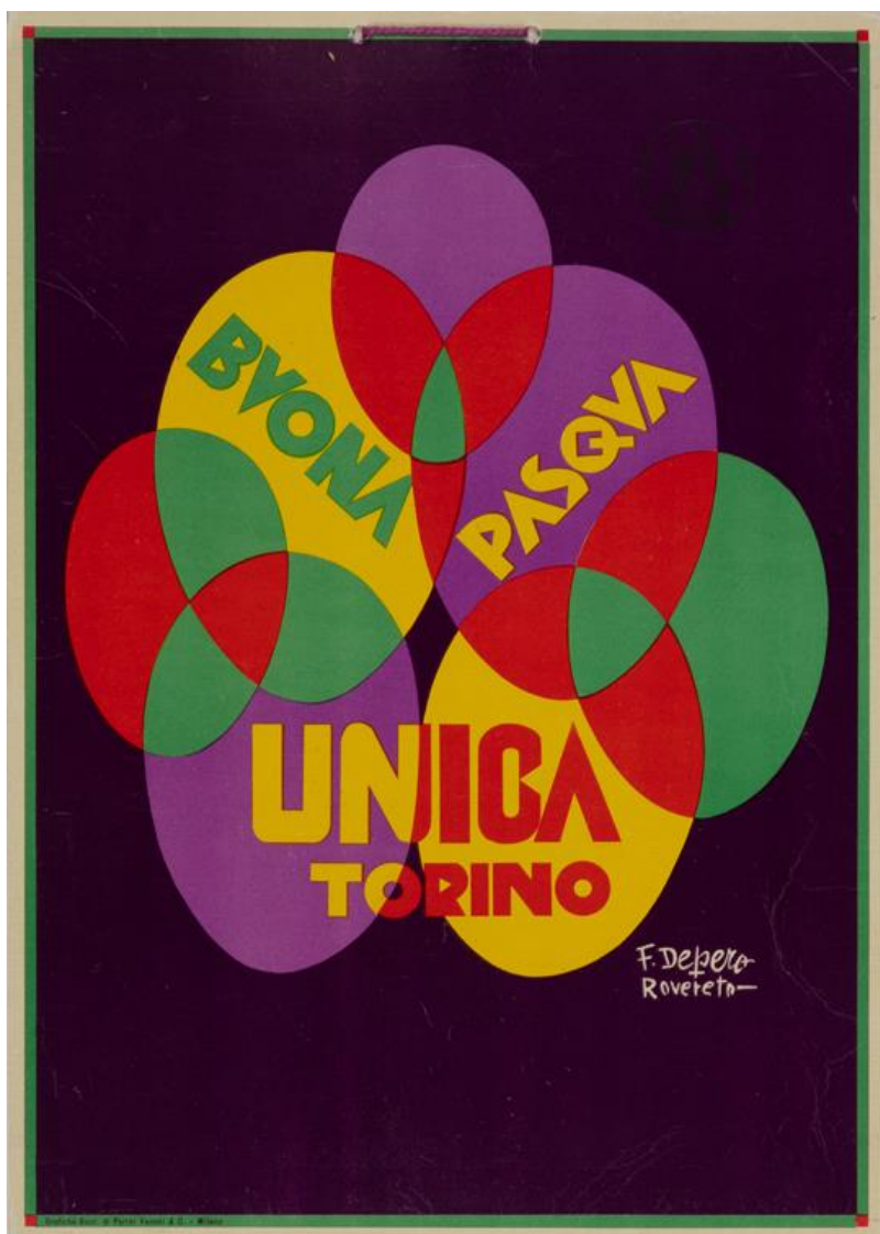
Fortunato Depero, Locandina pubblicitaria Torino-Unica, 1929, stampa tipografica, 34x24 cm. Mart, Provincia autonoma di Trento - Soprintendenza per i beni culturali.

Al Mart festeggiamo la Pasqua facendoci ispirare dalla vulcanica creatività di Fortunato Depero, artista futurista che ha lavorato anche come pubblicitario collaborando con molte ditte italiane e straniere. Per l'azienda dolciaria torinese Unica, alla fine degli anni Venti, realizza alcune campagne pubblicitarie tra cui questa coloratissima locandina con gli auguri di Buona Pasqua. L'azienda Unica produceva biscotti, caramelle e cioccolata, compreso quello delle tradizionali uova di Pasqua. Depero si è ispirato alla forma dell'uovo per questa festosa composizione dove gli ovali si sovrappongono creando spicchi di colori diversi. L'artista gioca con le tinte a contrasto, le forme stilizzate e le lettere, secondo il suo tipico stile futurista.