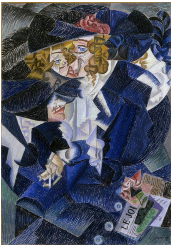
Gino Severini, Ritratto di Madame M.S. , 1913-15

Come puoi leggere nella sua biografia, Gino Severini è stato uno dei protagonisti della prima avanguardia italiana: il Futurismo. La sua scelta di lasciare l'Italia per vivere e lavorare a Parigi, nel 1906, non è insolita. All'inizio del '900, Parigi era la "capitale dell'arte" e vi confluivano artisti di diverse nazionalità. Rispetto agli altri artisti del movimento futurista, dunque, Severini opera a stretto contatto con i rappresentanti delle altre avanguardie di quel periodo e in particolare con i cubisti, la cui ricerca mostra molte affinità con la sua.